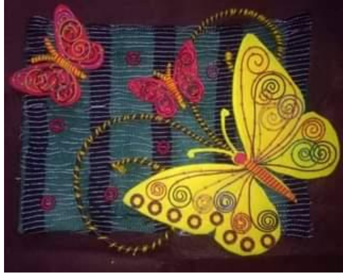
شكل رقم (3)