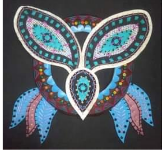
شكل رقم (1)