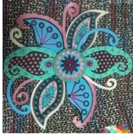
شكل رقم (4)