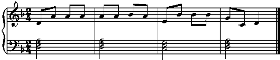
الشكل رقم (٢)