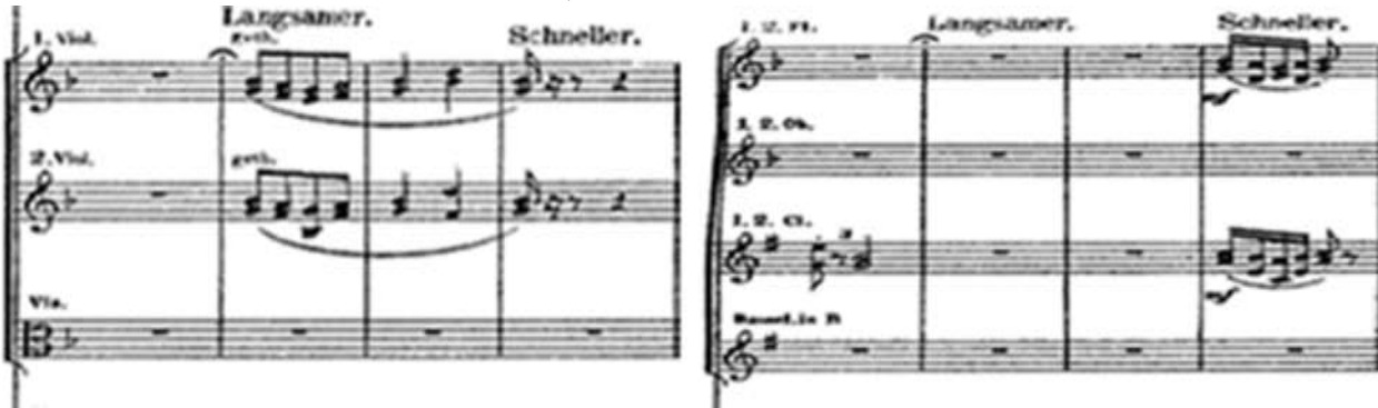
شكل (٢) يوضح المحاكاة بين الآلات الوترية و آلات النفخ من (م:١٠:١٢)

من (م:١٤:١٧): عبارته غير منتظمة تنتهي بقفلة تامة فى سلم ري/ص، بها حركة كروماتية صاعدة فى صوت التشيللو وحركة كروماتية هابطة فى صوت الكمان وبها تقوم آلات الكمان بتكرار الصوت البشري ولكن مع تكثيف الهارمونى ليعبر عن المأساة التى يعيشها المؤلف، وكان لحن الغناء فى حركة كروماتية هابطة ليعبر اللحن عن المشاعر الحزينة لزفاف حبيبته فيعبر عن يومه السيئ.