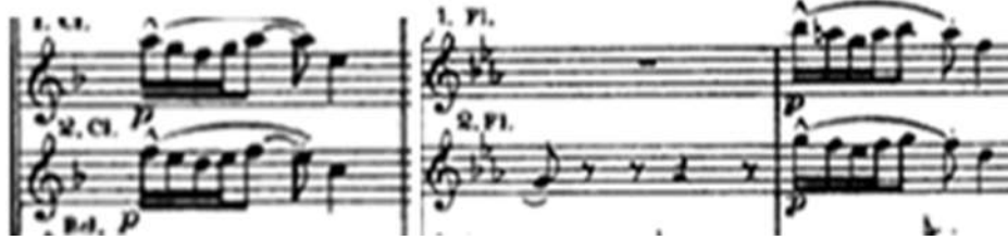
شكل (٩) يوضح المحاكاة بين آلتى الفلوت والكلايرنت من (م ٥٥:م ٥٦)

من (م ٥٠:م ٥٣): عباة غير منتظمة تنتهى ببقلة نصفية فى سلم مي ب/ك بها محاكاة بين آلتى الأبوا والكلايرنت. من (م ٥٣:م ٦٤): جملة موسيقية مطولة تنتهى ببقلة نصفية فى سلم صول/ص تم التحويل باستخدام التألف المشترك،أستخدم بها نغمات التطعيم على الدرجة السادسة والرابعة للتعبير عن الحزن الذى يشعر بيه، بها محاكاة بين آلة الفلوت وآلة الكلايرنت، وبين آلتى الفلوت والكمان مع تغير بسيط فى الإيقاع.