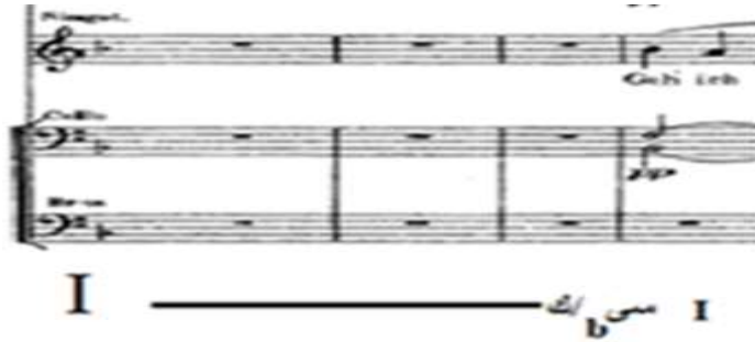
شكل (٥) يوضح التحويل باستخدام التألف المشترك مازورة ٢٢

كما يوضح الحركة الكروماتية في صوت التشيللو من (م:١٥:١٧) من (م:١٨:٢٢): فاصل موسيقى مأخذ من المقدمة تنتهي بقفلة دينية في سلم ري/ص، بها تكثيف هارموني لإعطاء جواً أكثر قتامة. من (م:٢٢:٢٩): جملة موسيقية منتظمة تنتهي بقفلة تامة في سلم سي/ب ك تم التحويل فيها باستخدام تألف مشترك وبها فاصل موسيقى للأوركسترا بتكثيف هارموني للتعبير عن الظلام المحيط بحياته ومحاكاة لحنية بين الآلات الوترية والنفخ وتقوم مجموعة الكمان بتكرار الصوت البشري، كما تم استخدام نغمتي البديل في صوت آلة التشيللو.