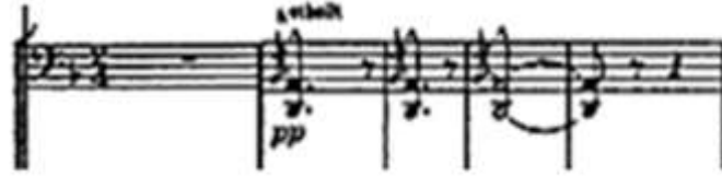
شكل (١) يوضح نغمات البديل في آلة التشيللو

من (م:٩:١٣): عبارة موسيقية مطولة تنتهي بقفلة دينية في سلم ري/ص، يظهر بها حوار بين الآلات الوترية وآلات النفخ من خلال تكرار نفس اللحن مرة أخرى في آلتى الفلوت