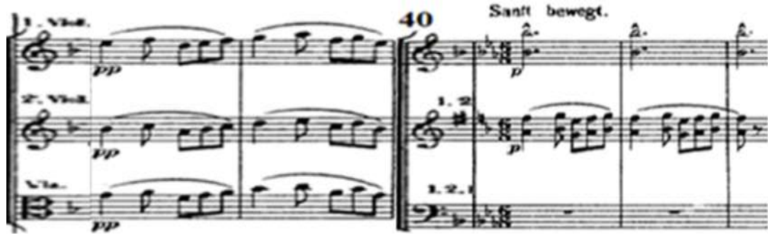
شكل (٨) يوضح المحاكاة بين صوت آلة الكلايرنت والآلات الوترية

بها فاصل موسيقي ذات تكثيف هارموني، وبها محاكاة بين صوت الكلايرنت وصوت الآلات الوترية.