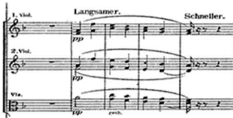
شكل (٣) يوضح تكرار الصوت البشري فى الآلات الوترية من (م:١٤:١٧)

من (م:١٤:١٧): عبارته غير منتظمة تنتهي بقفلة تامة فى سلم ري/ص، بها حركة كروماتية صاعدة فى صوت التشيللو وحركة كروماتية هابطة فى صوت الكمان وبها تقوم آلات الكمان بتكرار الصوت البشري ولكن مع تكثيف الهارمونى ليعبر عن المأساة التى يعيشها المؤلف، وكان لحن الغناء فى حركة كروماتية هابطة ليعبر اللحن عن المشاعر الحزينة لزفاف حبيبته فيعبر عن يومه السيئ.