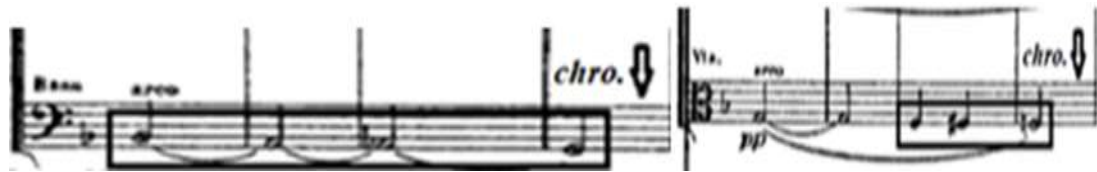
شكل (٧) يوضح الحركة الكروماتية الهابطة في صوت الفيولا والكونترباس

من (م:٣٠:٣٧): جملة موسيقية مطولة تنتهي بقفلة تامة في سلم دو/ص، تم التحويل فيها باستخدام التألف المشترك، بها حركة كروماتية هابطة في صوت الفيولا والكونترباس استخدم المؤلف المنطقة الوسطى في الغناء لبيكائه على حبيبته وتأثره الشديد بالفراق.