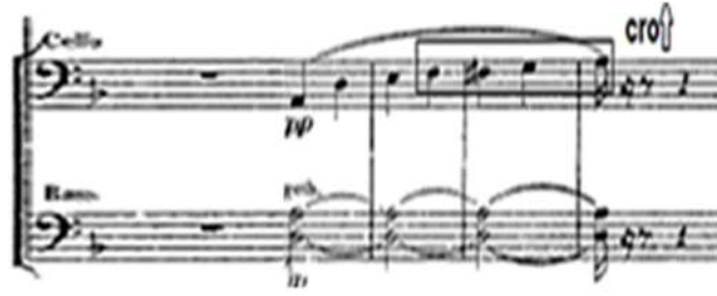
شكل (٤) يوضح نغمات البديل في صوت الباص من (م:١٤:١٧)،

كما يوضح الحركة الكروماتية في صوت التشيللو من (م:١٥:١٧) من (م:١٨:٢٢): فاصل موسيقى مأخذ من المقدمة تنتهي بقفلة دينية في سلم ري/ص، بها تكثيف هارموني لإعطاء جواً أكثر قتامة. من (م:٢٢:٢٩): جملة موسيقية منتظمة تنتهي بقفلة تامة في سلم سي/ب ك تم التحويل فيها باستخدام تألف مشترك وبها فاصل موسيقى للأوركسترا بتكثيف هارموني للتعبير عن الظلام المحيط بحياته ومحاكاة لحنية بين الآلات الوترية والنفخ وتقوم مجموعة الكمان بتكرار الصوت البشري، كما تم استخدام نغمتي البديل في صوت آلة التشيللو.