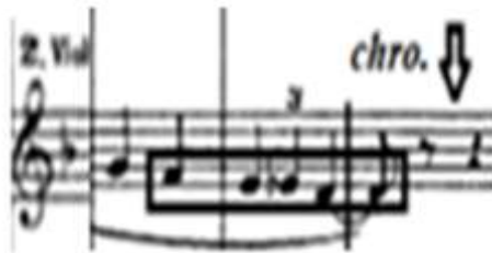
شكل (١١) يوضح الحركة الكروماتية الهابطة فى آلة الكمان من (م ٧٢:م ٧٤)

من (م ٦٤:م ٧٦): جملة مطولة تنتهى ببقلة تامة فى سلم ري/ص تم التحويل باستخدام التألف المشترك، بها حركة كروماتية هابطة فى صوت الكمان، تم إعادة الجزء الأول من اللحن مرة أخرى مع تغير النص الشعري والرجوع إلى الميزان الرئيسي 2/4.