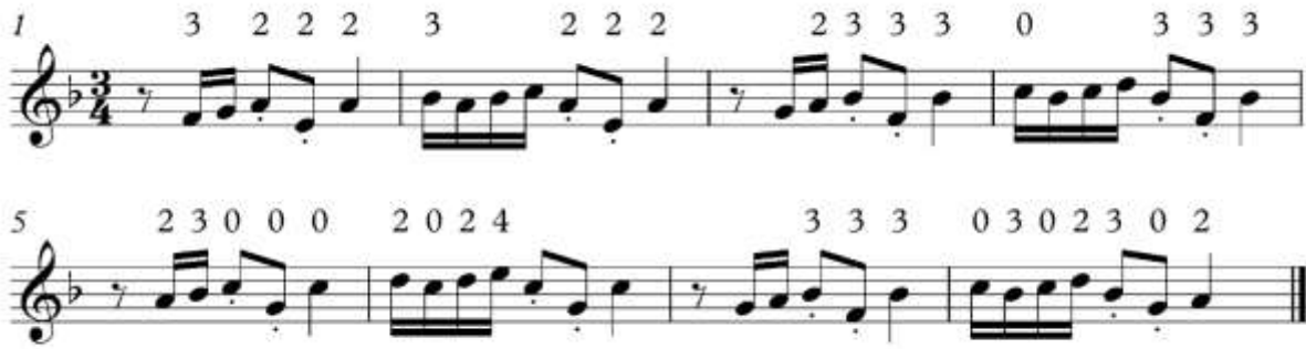
شكل (٨) التدريب الثالث المقترح: للتدريب على العزف المتصل والمتقطع