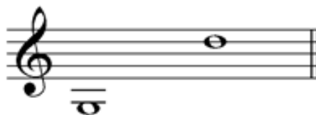
شكل (٢) المساحة الصوتية التسليمه فانتازيا كرد الحسيني

في مقام كرد على درجة الحسيني، تنحصر مساحتها الصوتية بين الدرجتين (اليكاه و المحير)