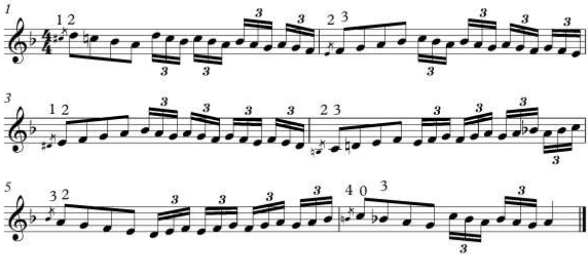
شكل (٦) التدريب الثاني المقترح: للتدريب على حلية الاتشيكاتورا والتتابعات اللحنية

التدريب الثاني المقترح: للتدريب على حلية الاتشيكاتورا والتتابعات اللحنية