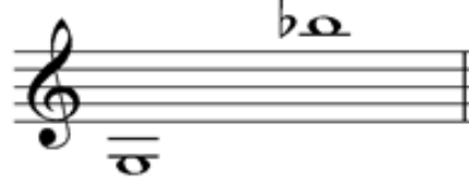
شكل (٥) المساحة الصوتية للخانة الثانية

م (١٢:١١) مقام نواثر على درجة النوى، م (١٩) مقام سوزناك على درجة الدوكاه، تنحصر مساحتها الصوتية بين الدرجتين (يكاه و جواب العجم)